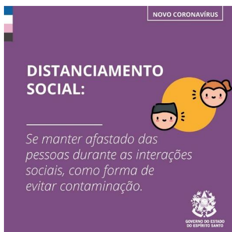
Imagem 3 e 4 – material publicitário Governo do Estado do Espírito Santo