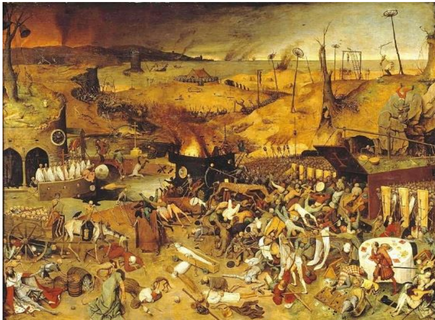
Imagem 1: O triunfo da morte – Brueghel.

“(…) as suas próprias roupas retinham a infecção, as suas mãos infectavam as coisas que tocavam, especialmente se estivessem quentes e suadas, e em geral também estavam aptas a suar” (Defoe, 1722 [2020, p.120]).