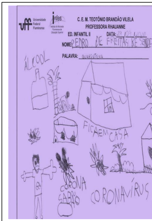
Pedro de Freitas Resende - Educação básica