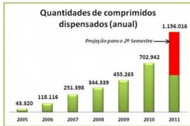
Gráfico 1 – Quantidade de comprimidos de metilfenidato dispensados em algumas cidades do Estado de São Paulo desde o ano de 2005 até o primeiro semestre de 2011