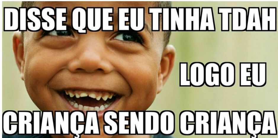
Figura 1 – “Meme” Logo eu.